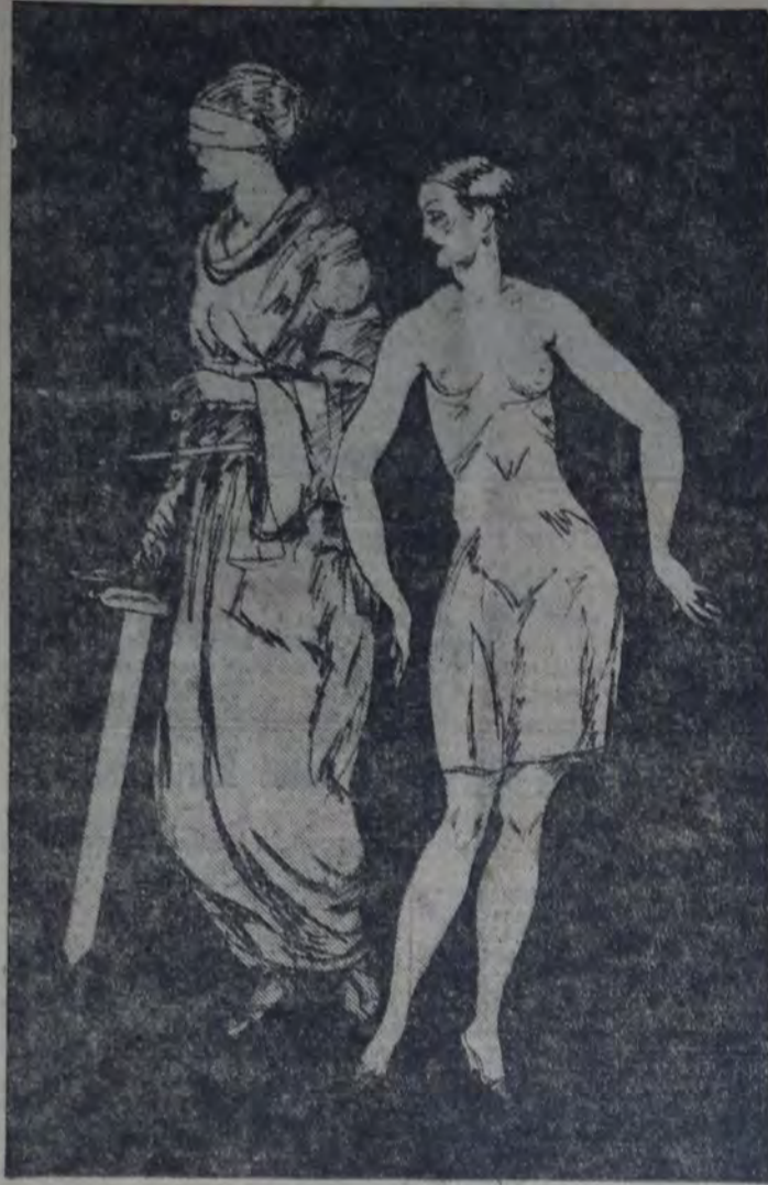
COMO ERA SEGUN LOS CLASICOS Y COMO ES HOY Y AQUI