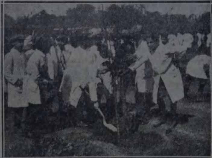
PLANTEMOS UN ARBOL... Y A LA OBRA. INQUIETAS MANOS INFANTILES, RINDEN SU CULTO AL ARBOL, PLANTANDO UNO CON EL MAS GENEROSO AFAN

que prodiga a la especie humana múltiples bienestar; desde la frescura propia al mueble indispensable y desde el oxígeno vivificante hasta el alimento que nutre y el techo que abriga.