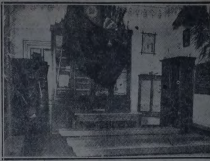
LA BIBLIOTECA DEL CENTRO SOCIALISTA

Hoy domingo, a las 9.30 horas, será inaugurada públicamente la casa adquirida por el Centro Socialista de la sección 1.a. (Nueva Chicago) situada en la calle Jachal 2416.