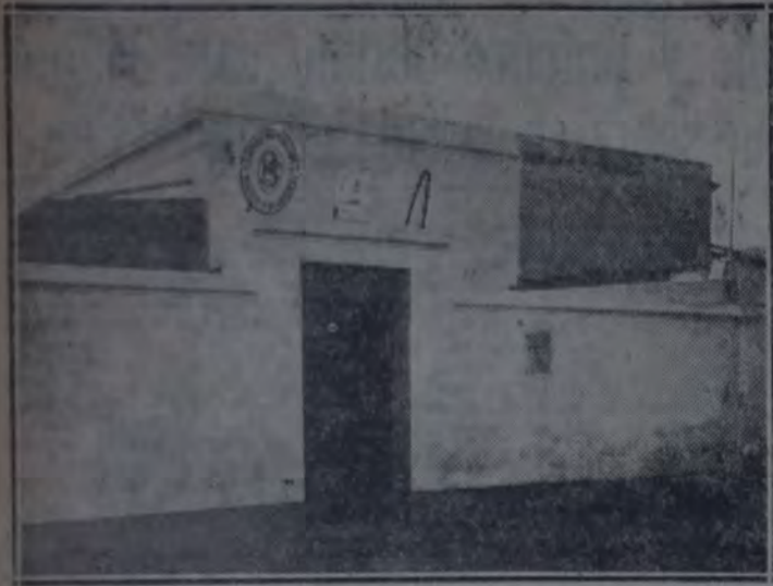
LA NUEVA CASA DEL CENTRO SOCIALISTA DE LA SECCION 1.a. (N. CHICAGO)