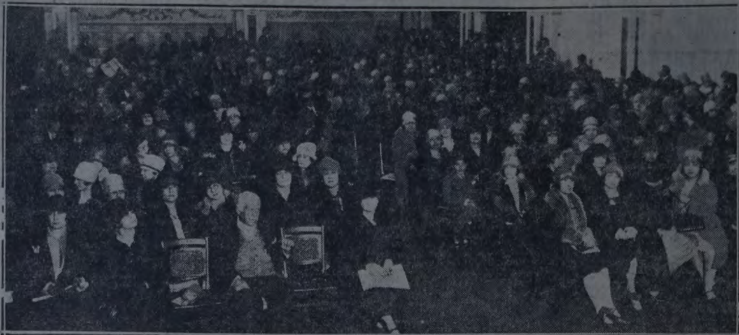
LOS CONCURRENTES AL IMPORTANTE MITIN DE AYER

material, sino también los que moralmente atañen al gremio. A tal efecto hizo un análisis extenso del caso ocurrido con el dignísimo maestro Salomón